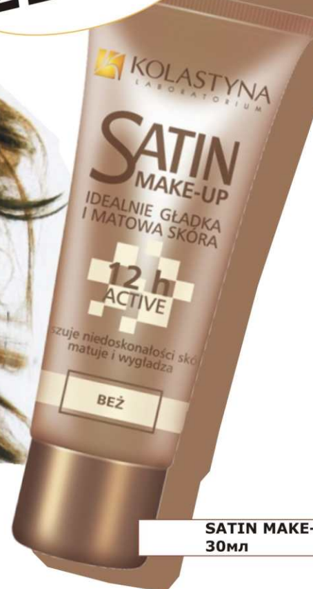
SATIN MAKE-UP - beige 30мл